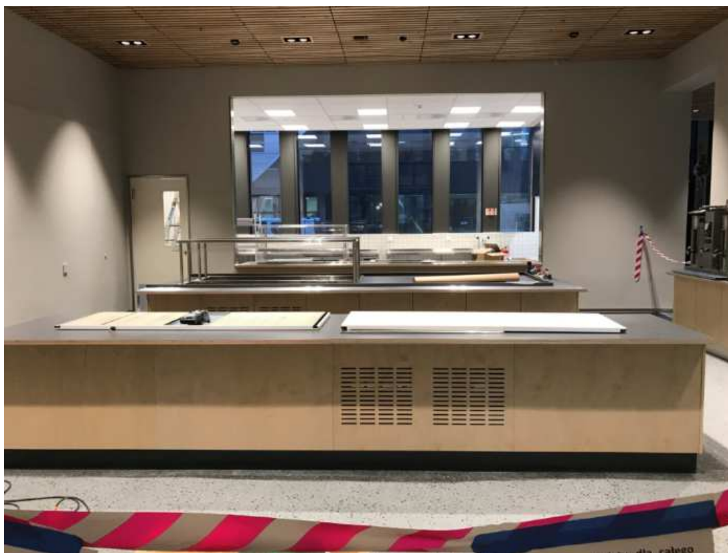
Serveringsområde med kjøkken i bakgrunn