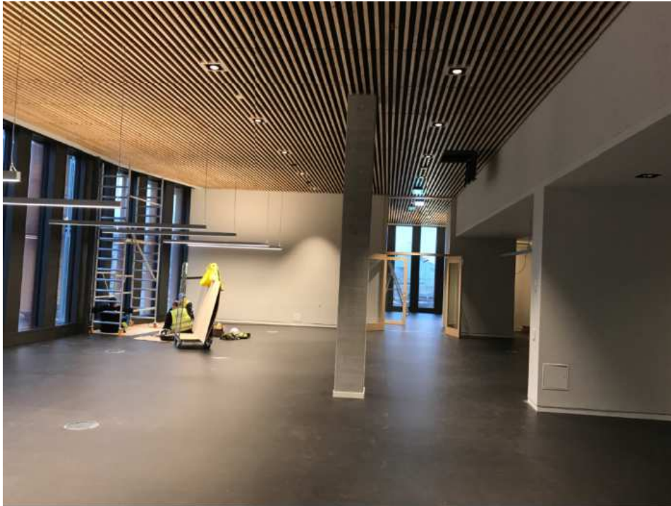
Service kontor området 1. et